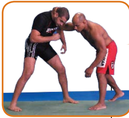
Cacareco domina o pescoço de Artilheiro com a mão direita